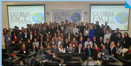
2016: Global Fact 3 (Argentina) Mais de 114, em 47 países