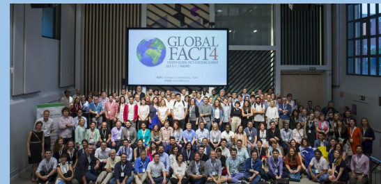
2017: Global Fact 4 (Espanha) Mais de 126, em 49 países