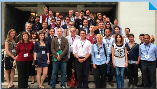
2014: Global Fact 1 (Reino Unido) Mais de 40, em 20 países